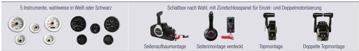
5 Instrumente, wahlweise in Weiß oder Schwarz

Flexible Zubehörbestellung: Ab dem Modell BF 60 – BF 100 (mechanisch geschaltete Motoren, Fernschaltmodelle) können Instrumente und Schaltbox individuell an Ihren Bootstyp angepasst werden. Für weitere Informationen zum Lieferumfang wenden Sie sich bitte an Ihren Händler.