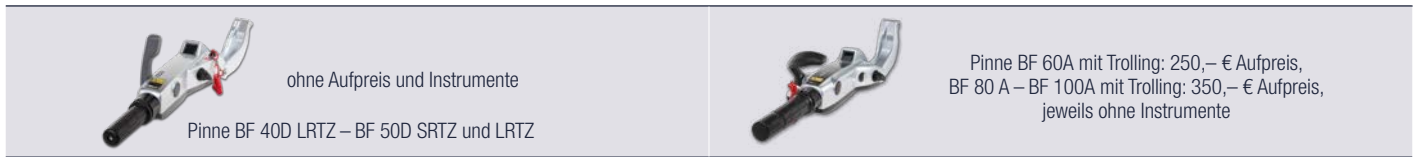
ohne Aufpreis und Instrumente

Zubehörbestellung: Ab den Modellen BF 40 – BF 100A (Pinnenmodelle) besteht die Möglichkeit, die Pinne ohne Instrumente zu bestellen. Für weitere Informationen zum Lieferumfang wenden Sie sich bitte an Ihren Händler.