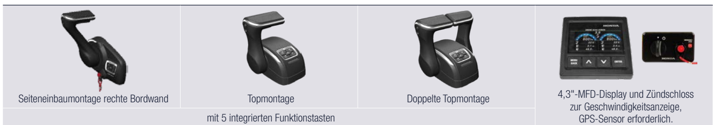
Seiteneinbaumontage rechte Bordwand

Flexible Zubehörbestellung: Ab den Modellen BF 115J K1 – BF 250D K1 (elektronisch geschaltete Motoren, D-Version) sowie BF 300A – BF 350A besteht die Möglichkeit, die Schaltbox individuell an Ihren Bootstyp anzupassen. Das 4,3"-MFD-Display kann bis zu vier Motoren über das NMEA2000®-Netzwerk anzeigen. Für weitere Informationen zum Lieferumfang wenden Sie sich bitte an Ihren Händler.